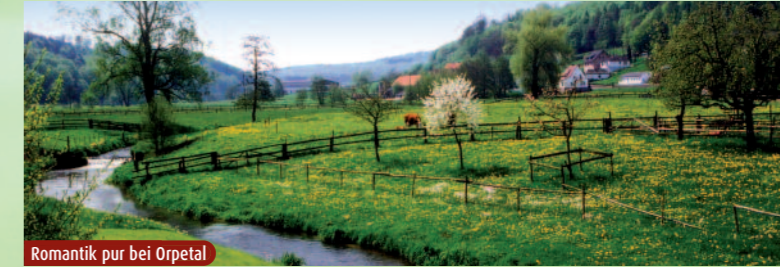
Romantik pur bei Orpetal

Fahrplaninfos & Reservierungen für den NPH Fahrradbus: BBH-Kundeninformation, Tel. 0 52 51/ 20 13 0, www.nph.de