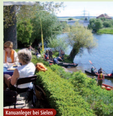
Kanuanleger bei Sielen

Fahren Sie bequem ohne große Steigungen und orientieren Sie sich an der Beschilderung mit den markanten Ammoniten.