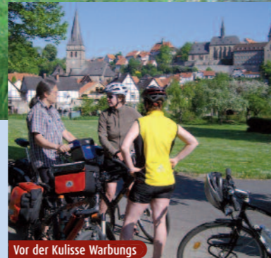
Vor der Kulisse Warburgs

Gönnen Sie sich Genuss-Radeln an der Diemel. "Verdiemeln" Sie Ihre Zeit bei uns.