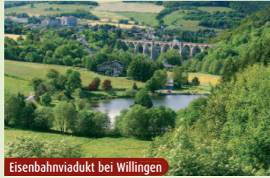
Eisenbahnviadukt bei Willingen