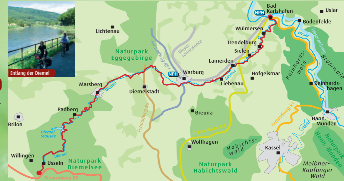
Entlang der Diemel

Schlagen Sie dem Stress ein Schnippchen. Wenn Ihnen im Alltag die Zeit stets wegläuft, dann lassen Sie sie auch mal frei laufen ... und gönnen Sie sich ein paar Tage Entspannung am Diemelradweg. Begleiten Sie die Diemel auf 110 km Radweg von ihrer Quelle in Usseln bis zur Mündung in Bad Karlshafen!