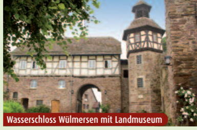
Wasserschloss Wülmersen mit Landmuseum